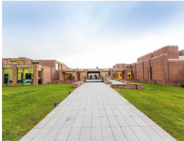
LAM - Musée d'art moderne à Villeneuve d'Ascq