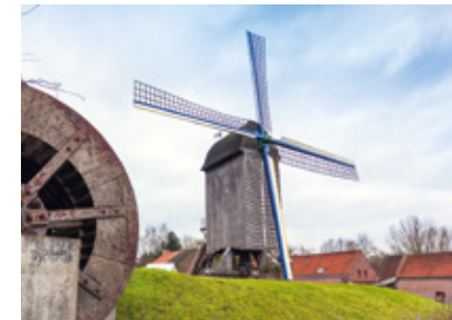
Moulins de Villeneuve d'Ascq