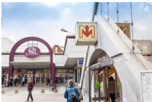
Centre commercial Auchan V2

Villeneuve d'Ascq a de multiples atouts comme son grand centre commercial V2 et ses nombreuses enseignes, restaurants et hypermarchés... Grand pôle universitaire (Lille 3), la commune propose également, dans tous ses quartiers, des établissements scolaires de la crèche au lycée.