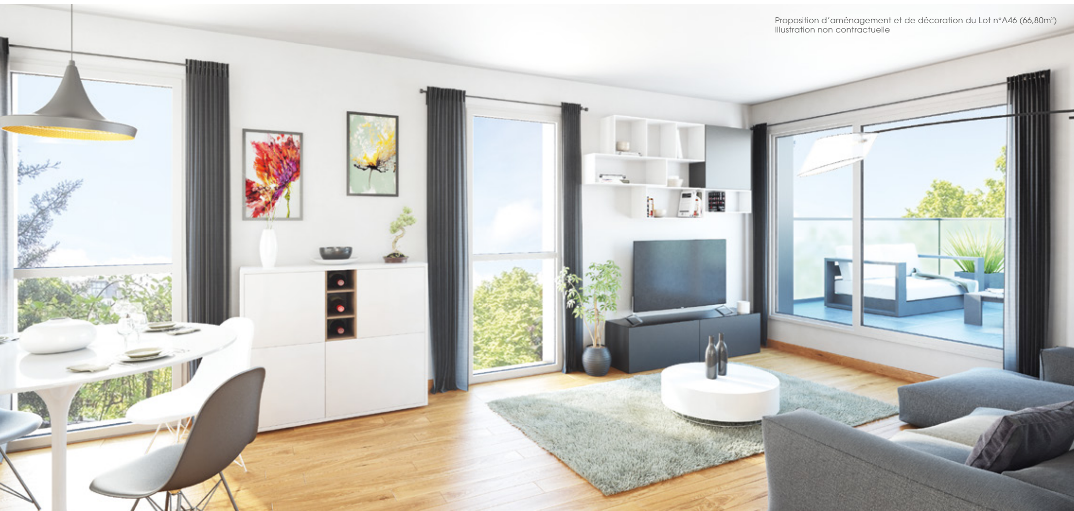
Proposition d'aménagement et de décoration du Lot n°A46 (66,80m²) Illustration non contractuelle