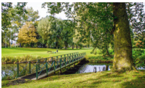
Parc du Golf de Brigode