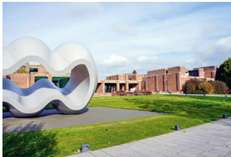
LAM - Musée d'art moderne à Villeneuve d'Ascq