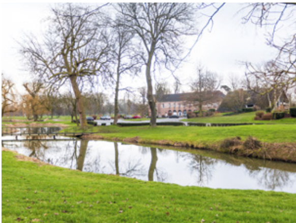
Parc du Golf de Brigode